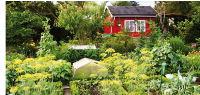
Kräuter- und Gemüsebeete

Weitere Informationen erhalten Sie unter: www.hannover.de