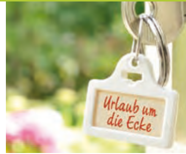
Schlüssel zum Glück