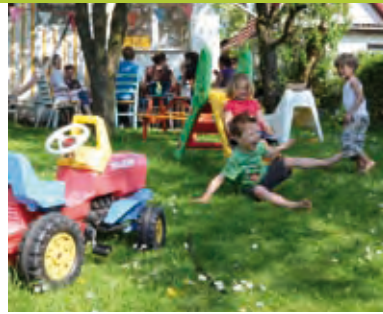
Der Garten als Spielplatz